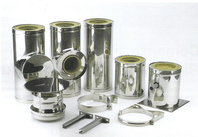
Rozmanité příslušenství komínového systému Schiedel Kerastar

Systém Schiedel Kerastar se vyrábí v průměrech 140, 160, 180, 200 a 250 mm. Výška jednotlivých prvků je 165, 330 a 665 mm, součástí příslušenství jsou T-kusy, čistící kusy, běžné roury, kondenzátní misky a průchodky. Komínový systém lze zakládat na výškově přestavitelnou stoličku, na dno s odvodem kondenzátu a podpěrou umístěnou přímo na